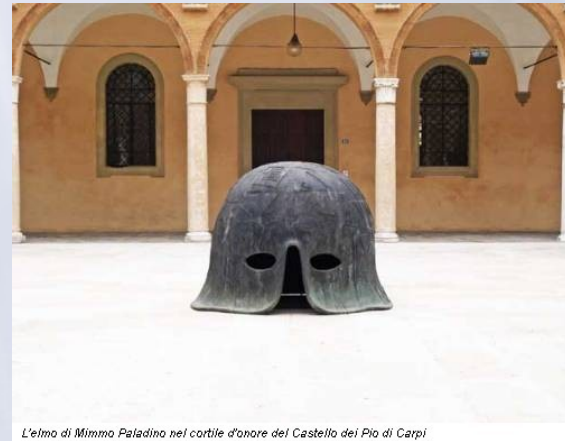
L'elmo di Mimmo Paladino nel cortile d'onore del Castello dei Pio di Carpi

A: autonomia – apprendimento – emergenza [Ilya Prigogine; Francois Jacob]