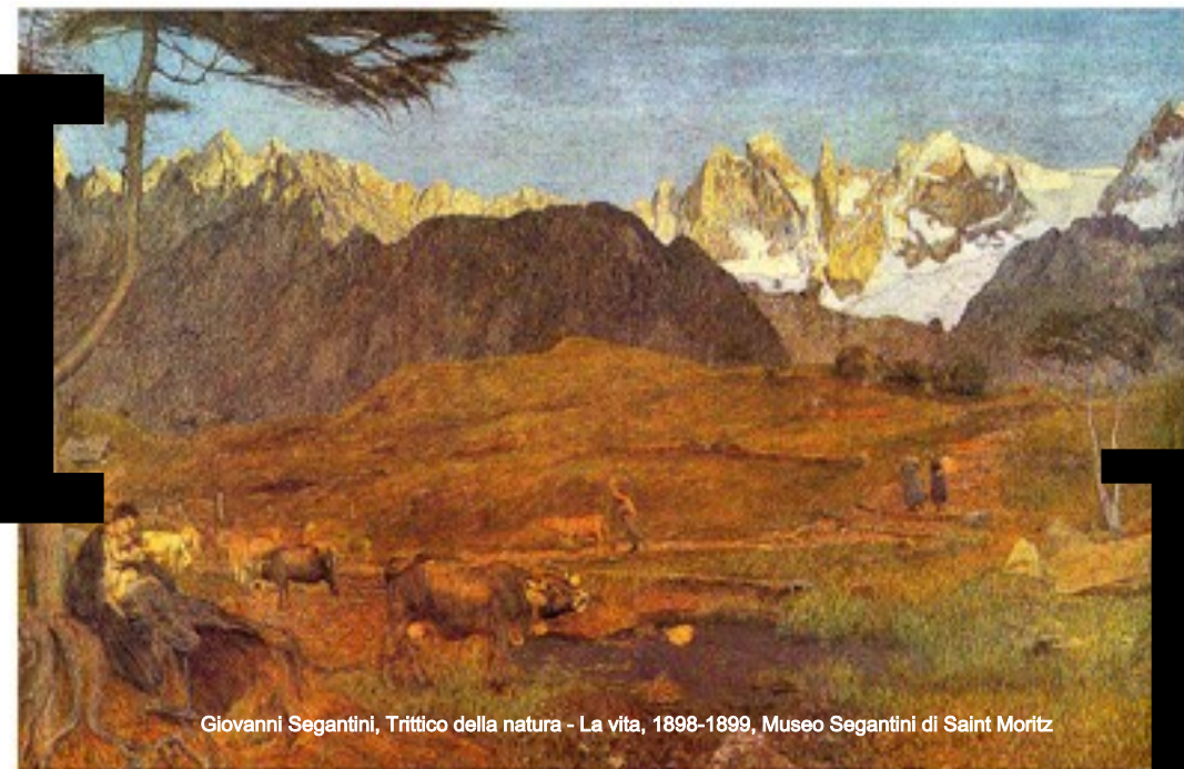
Giovanni Segantini, Trittico della natura - La vita, 1898-1899, Museo Segantini di Saint Moritz