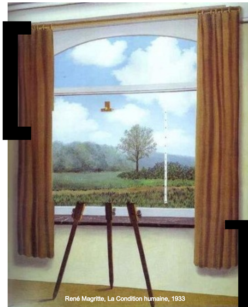
René Magritte, La Condition humaine, 1933